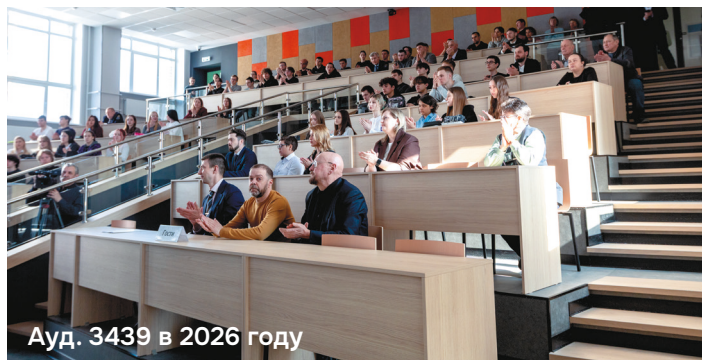
Ауд. 3439 в 2026 году