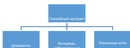
Рисунок 1 - Процесс заключения служебного контракта [8, с. 46]

Если рисунок взят из первичного источника без авторской переработки, следует сделать ссылку, например: