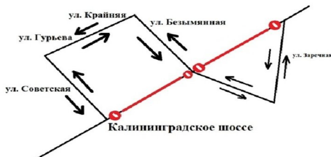
Рисунок 2 – Схема объезда 5

Если рисунок является авторской разработкой, необходимо после заголовка рисунка поставить знак сноски и указать в форме подстрочной сноски внизу страницы, на основании каких источников он составлен, например: