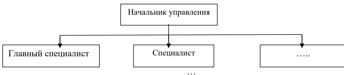
Рисунок 1 – Структура управления

Рисунки следует нумеровать арабскими цифрами сквозной нумерацией по всей работе. Каждый рисунок (схема, график, диаграмма) обозначается словом «Рисунок», должен иметь заголовок и подписываться следующим образом – посередине строки без абзацного отступа, например: