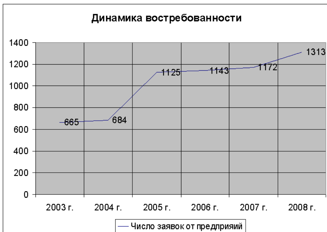
Рис.8.2.3 Диаграмма «Динамика востребованности»

В целом проведенное исследование показало, что наиболее высокий уровень трудоустроенности студентов наблюдается по специальностям направления «Горное дело», «Горные машины и оборудование», «Электропривод и автоматика промышленных установок технологических комплексов» дневной формы обучения. Показатели трудоустройства выпускников УГГУ позволяют сделать вывод об их востребованности и конкурентоспособности на рынке труда.